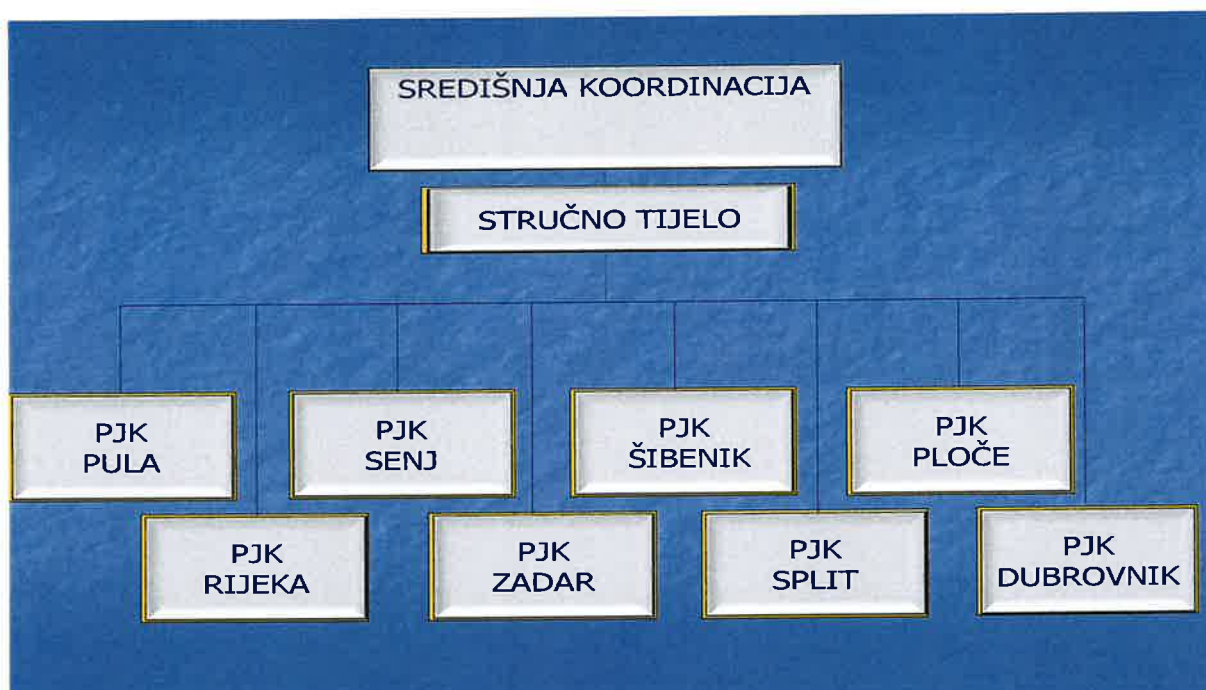
Slika 2.: Ustroj i struktura zajedničkog sustava nadzora mora